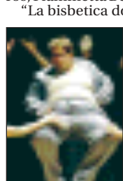
Una scena dello spettacolo